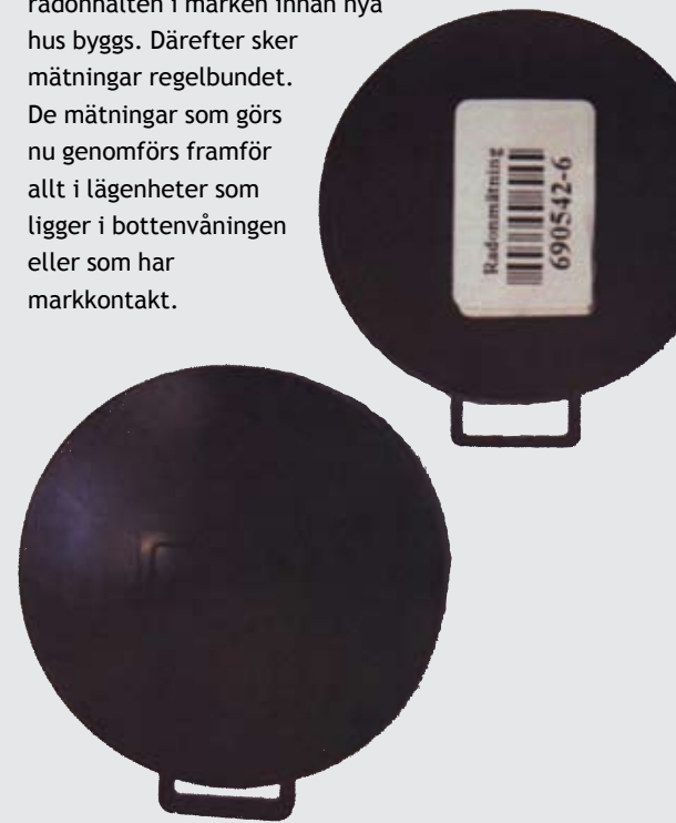
Så här ser mätinstrumenten ut.

Strömstadsbyggen mäter alltid radonhalten i marken innan nya hus byggs. Därefter sker mätningar regelbundet. De mätningar som görs nu genomförs framför allt i lägenheter som ligger i bottenvåningen eller som har markkontakt.